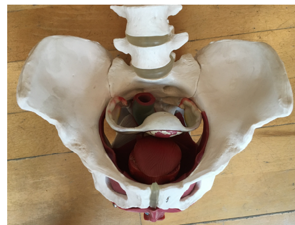
De kvindelige reproduktive organer

Med specifikke øvelser kan du øge dine chancer for at blive naturligt gravid